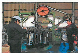
最新設備の見学の受入れ

当時、事業後継者であった現代表の提案で設備の近代化（日本で初めての海外製の最新のロープ製造機の導入）を同業異業者を問わず公開する取組を行う。通常は極秘事項であろう同社の製造設備の見学の受入れは、同業異業者を問わず色々な人脈の構築に成功した。技術・ノウハウの伝承や従業員教育方法、営業手法なども長年の積み重ねにより習得し、昨年法人化の際に代表取締役役に就任することにより、円滑な事業継承を行うことができた。