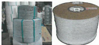
スーパー繊維による最新ロープの開発

同社がロープ製造一筋100年の歴史の中で培ってきた経験やノウハウは、同業他社には絶対まねできない最大の強みであり日本でもトップレベルである。最近では、スーパー繊維と呼ばれる最先端繊維による漁業用ロープや漁網の製造販売に力を入れている。ワイヤーロープと同等の強度を持ち、軽くて取扱いが簡単で、さらに耐久性も飛躍的に高くなる新型ロープは、非常に割高になるものの、訴求の方法を工夫して国外製品との差別化ができれば、市場を切り開くことができると確信している。