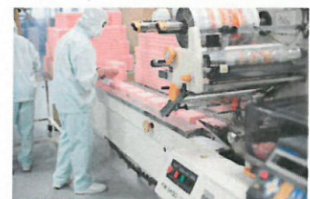
スポンジの自動包装加工

同社は「お客様によいものをお届けしたい」との意識を全社で共有し、社員一人一人の努力や創意工夫で、業界で初めて溶剤を使用しない接着（ホットメルト接着）する設備を開発・導入し、「一歩すすんだ無溶剤接着加工品」の表示で「安心・安全」な製品を提供している。あわせて、業界でいち早く取り組んだクリーンルームでの包装加工、金属検知装置等により品質管理に徹底的に取り組み、時代やお客様が求めるニーズに対してスピーディに対応している。