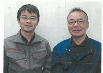
現社長と先代社長

同社は祖父の代から3代続くものづくり企業であり、現・代表取締役は、2016年4月に社長に就任。新社長は大学卒業後、同社に入社し7年間修行を積んできた。以前から先代社長は早めの事業承継を考えており、その旨、現代表へも伝えていたので、事業承継は円滑に行われた。若干29歳の新社長が事業承継してから海外展開、人材確保、自社ブランド強化など本格始動している。伝統を守りつつ新しいことにチャレンジし、老舗ハサミメーカーの更なる成長につなげている。