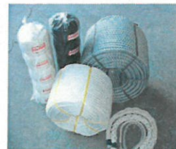
新型製網機を導入し総合メーカーへ

現在、ドイツ製の最新式製網機の導入を進めている。スーパー繊維の製造のみならず国内でも品薄となっている八ツ打ちロープ製の製造も可能となり、防音処理も行われている。騒音も少なく人員もかからないこの機械を深夜を問わず稼働させることにより、飛躍的な生産量のアップを目指している。先述のスーパー繊維ロープについては価格的に割高であるため小分け販売用の製造販売にも取り組み、この工夫により少しずつであるが販売量がアップしている。