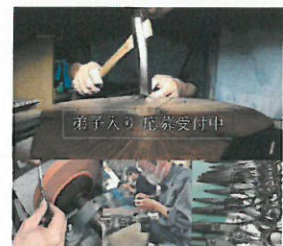
弟子入り募集の広告求人

社員の平均年齢は45歳。ベテラン熟練工員の技術を後世に伝承するため、若者の採用に積極的に取り組む。「ものづくりに興味のある若者」をターゲットに、市内の工業高校・高専、ジョブカフェ、求人サイト、SNS等を駆使した結果、同社にとっては初めての女性社員を今後採用予定。これまでは男性中心の職場であったが、女性職人が活躍するものづくり企業のロールモデルとして職場環境の整備等々に力を入れている。