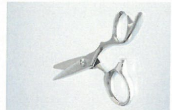
理美容ハサミ「コバルトシリーズ」

創業以来60年以上、理美容師が快適に使っていただけるハサミを設計・製造しているものづくり企業。1973年に同社が開発し、2015年にグッドデザイン賞を受賞した自社ブランド「コバルトシリーズ」は、世界で始めてコバルト基金合金を使用したハサミであり、鉄をほとんど含まないため、さびることがなく、切れ味が長続きする。「ものづくり・品質」を一番に考えながら、米国への海外展開、将来を見据えた人手不足対応等、未来に羽ばたく取組を展開している。