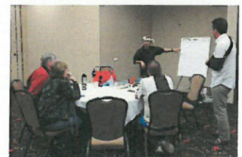
米国での講演の様子

2017年11月に米国で開かれたハサミ業界のコンベンションでは日本メーカーで唯一の招待を受け、「日本の理美容ハサミの製造技術の高さ」の講演、修理技術を米国人へ指導する等、日本の鋏職人の技と心を世界発信している。現在は市場調査を踏まえ、米国に向けた情報発信や商品開発も推進中。