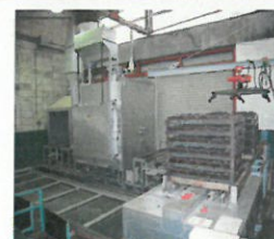
夜間無人運転焼戻炉

また、高周波焼き入れ装置（平成25年度ものづくり補助金事業で採択）の導入により、メリヤス編針の強度向上を実現。更に、YAGレーザー溶接装置（平成28年度ものづくり補助金事業で採択）は、ファインゲージメリヤス編針の品質及び耐久性を向上させ、付加価値の高いメリヤス編針を製造している。